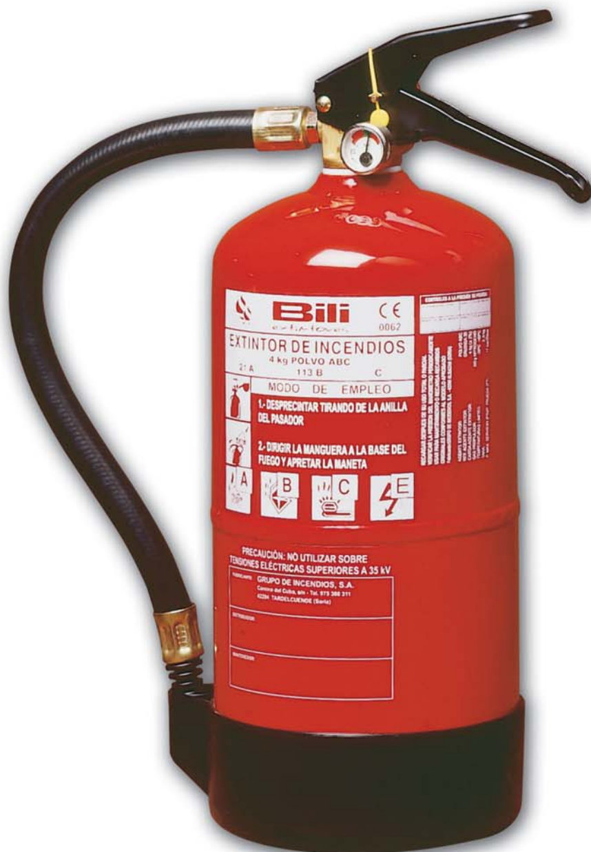
EXTINTOR PORTATIL 4 KG. POLVO ABC