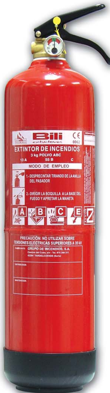
EXTINTOR PORTATIL 3 KG. POLVO ABC