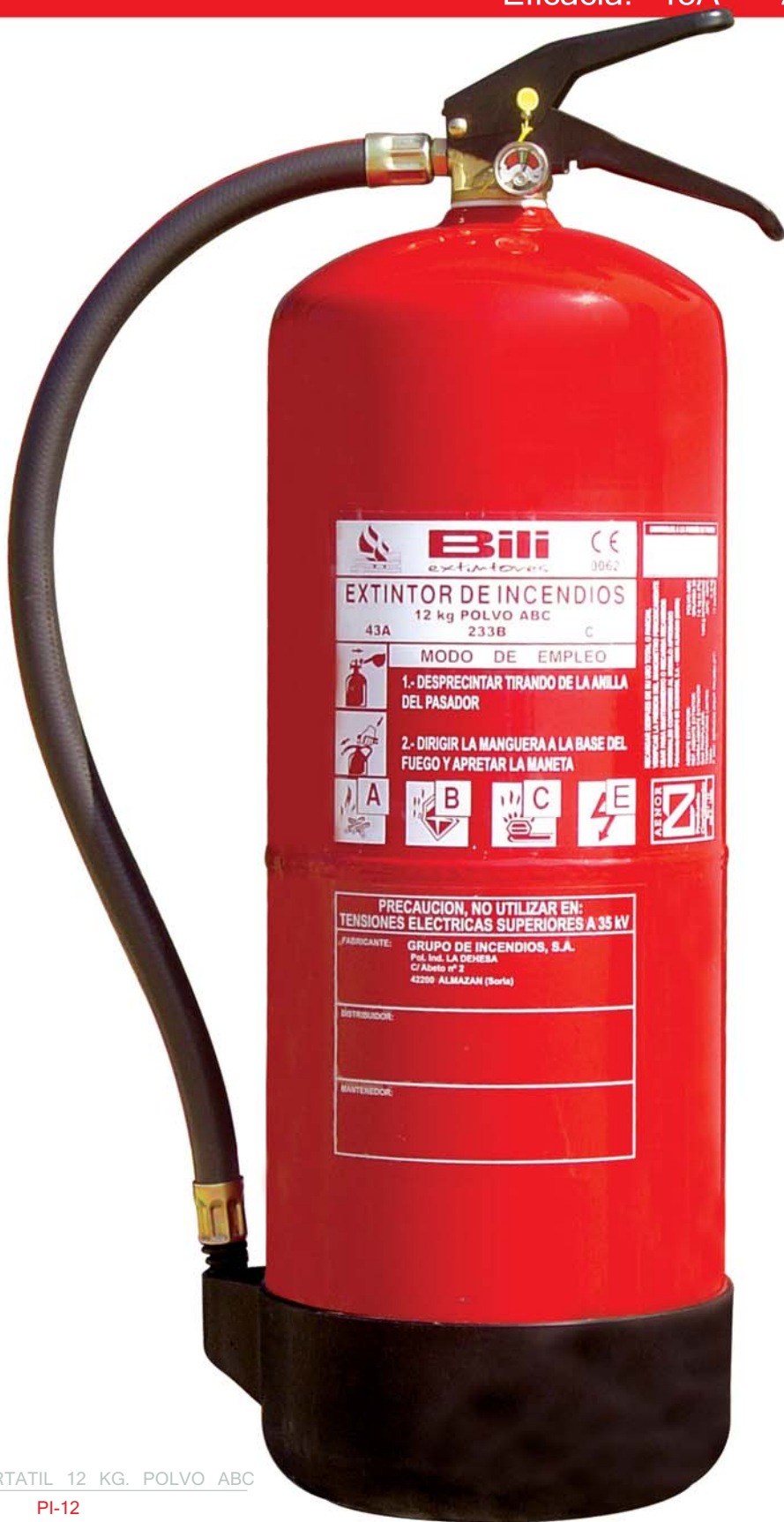
EXTINTOR PORTATIL 12 KG. POLVO ABC