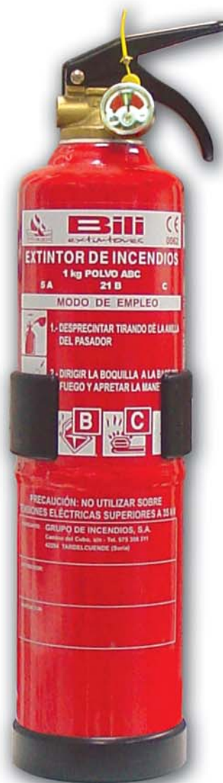
EXTINTOR PORTATIL 1 KG. POLVO ABC