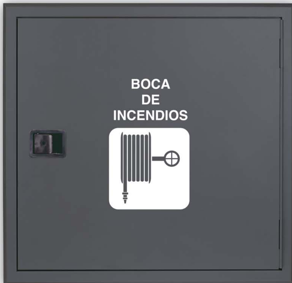
Modelo de la imagen acabado en color GRIS FORJA (Consulte con nuestros comerciales)

650 x 680 x 195 - ABATIBLE - ESPECIAL EMPOTRAR